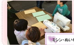
ミシン・ぬいもの