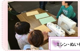
ミシン・ぬいもの